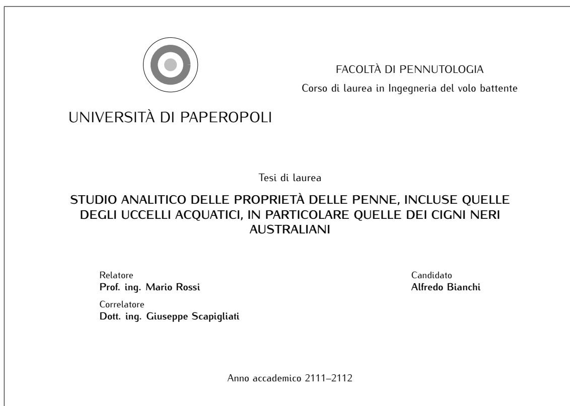
Figura 3.1. Frontespizio con l’orientamento landscape ottenuto sfruttando l’ambiente titlepage

scelte di un file PDF in un documento da comporre con \text{\LaTeX} . Se ne veda la documentazione aprendo un terminale o un prompt dei comandi, scrivendoci dentro texdoc pdfpages e poi premendo il tasto invio .