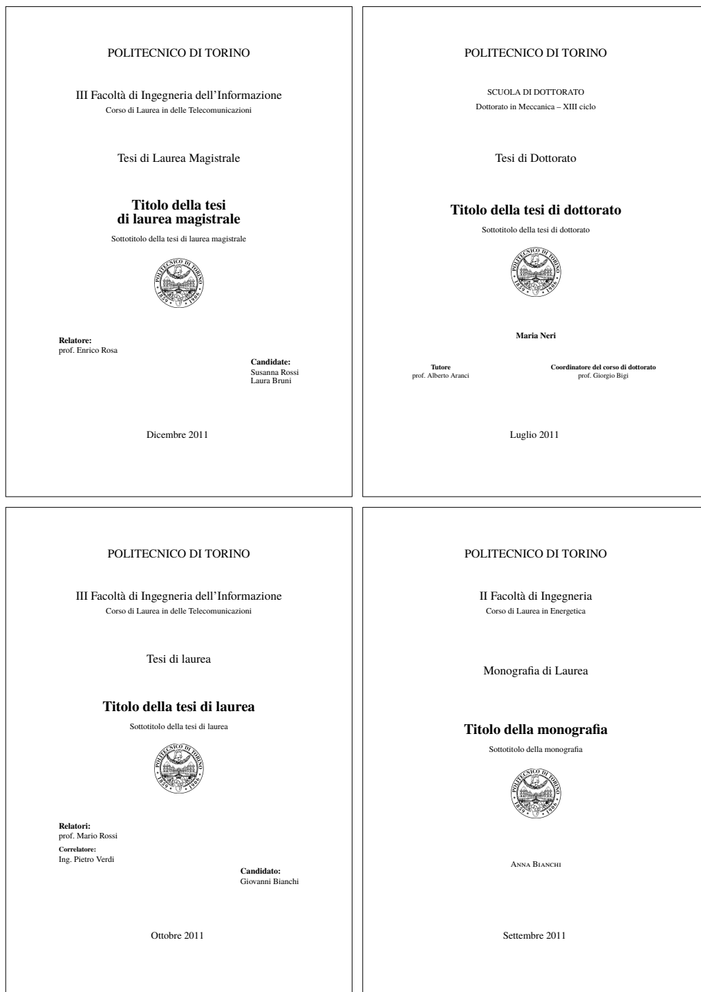
Figura 3.1. I quattro frontespizi fondamentali