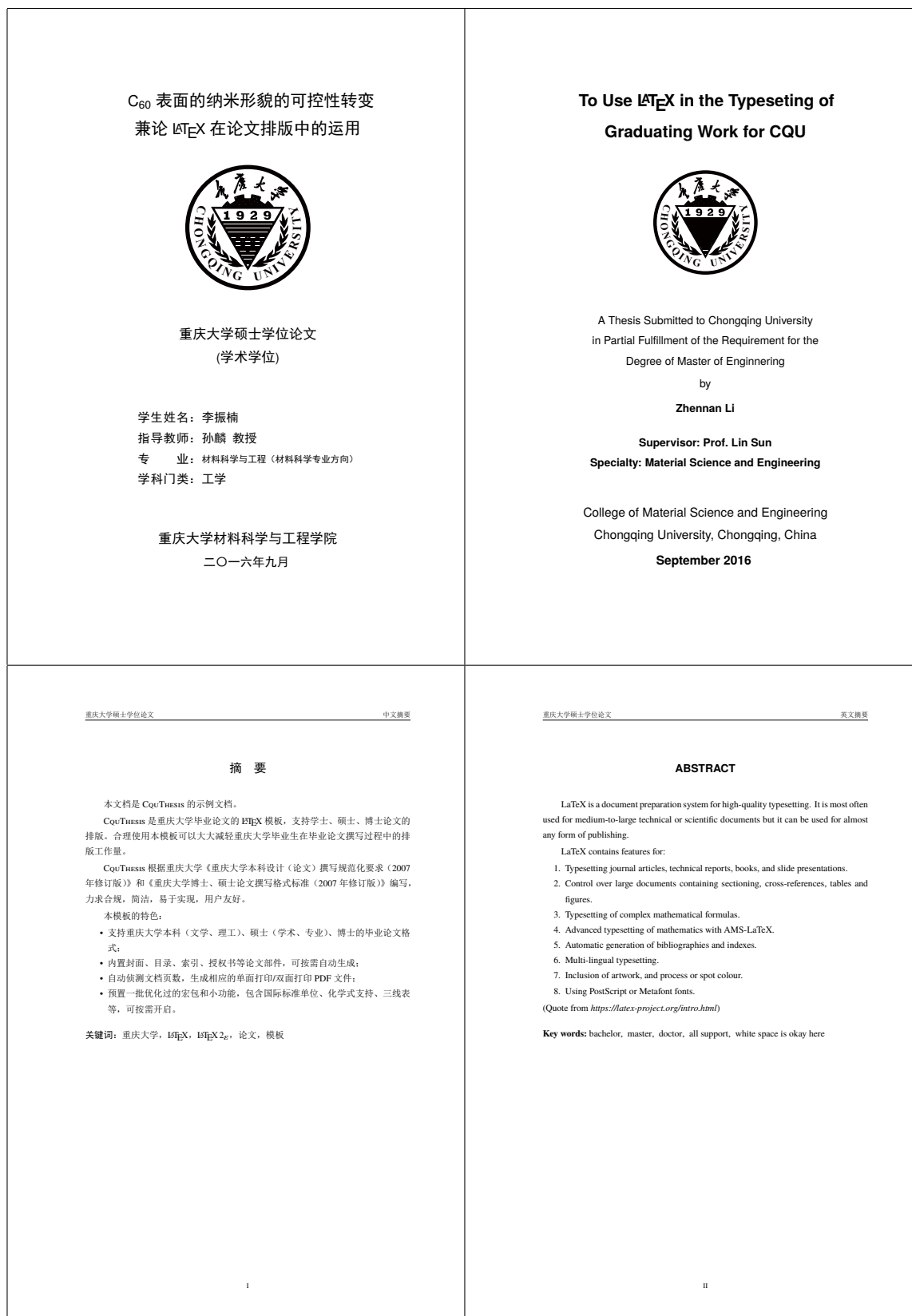
图 3: CQUThesis 中英文论文封面以及摘要示例, 本文档电子版可无限放大以查看细节, 良好的矢量图形支持是 \text{\TeX} 的一个特性。