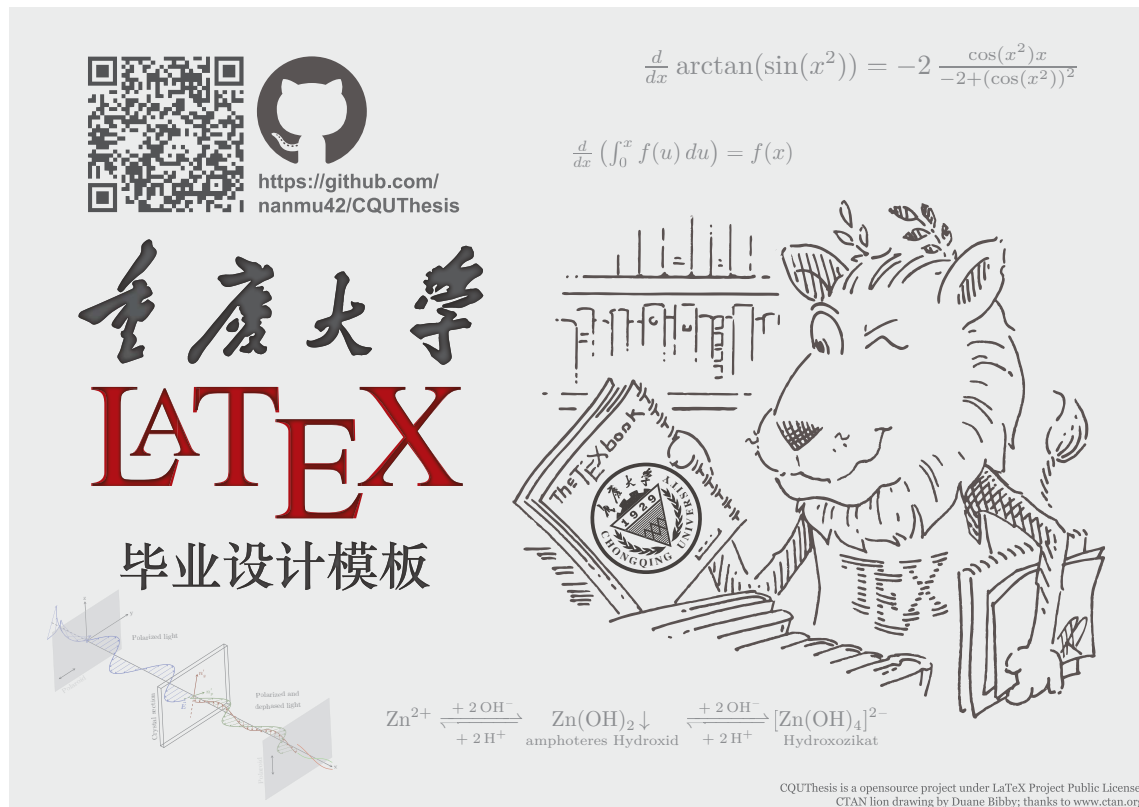
图 2: \text{CQUT}_{\text{HESIS}} 宣传海报, 本文档电子版可无限放大以查看细节