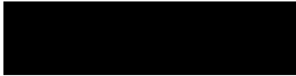
Figura 2 – Exemplo de fonte com sua figura.