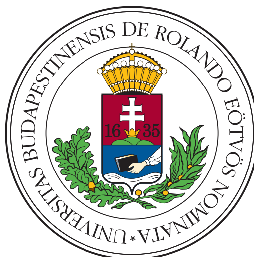
(b) Donec hendrerit quis dui sit amet venenatis