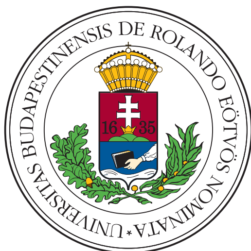
(a) Vestibulum quis mattis urna

In non ipsum fermentum urna feugiat rutrum a at odio. Pellentesque habitant morbi tristique senectus et netus et malesuada fames ac turpis egestas. Nulla tincidunt mattis nisl id suscipit. Sed bibendum ac felis sed volutpat. Nam pharetra nisi nec facilisis faucibus. Aenean tristique nec libero non commodo. Nulla egestas laoreet tempus. Nunc eu aliquet nulla, quis vehicula dui. Proin ac risus sodales, gravida nisi vitae, efficitur neque, 2.3. ábra: