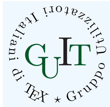
(b) Immagine con sfondo.