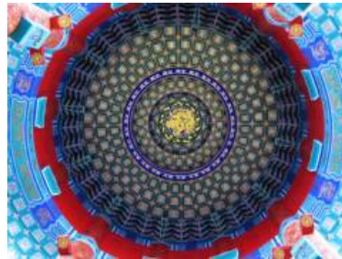
(d) Titulo debitas.