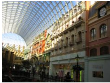
(a) Asia personas duo.